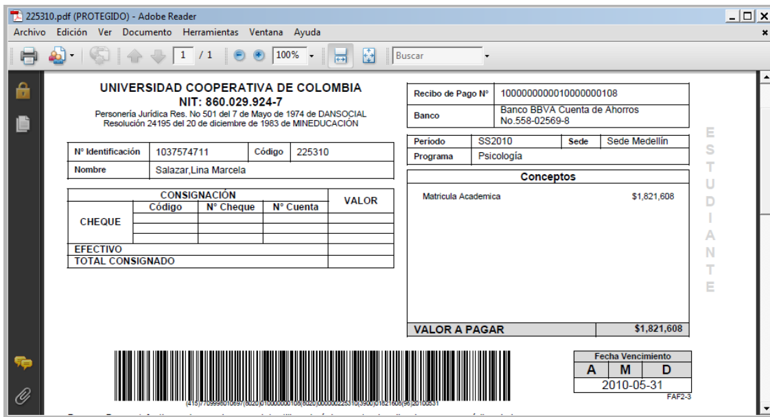
Figura 8 Recibo de Pago