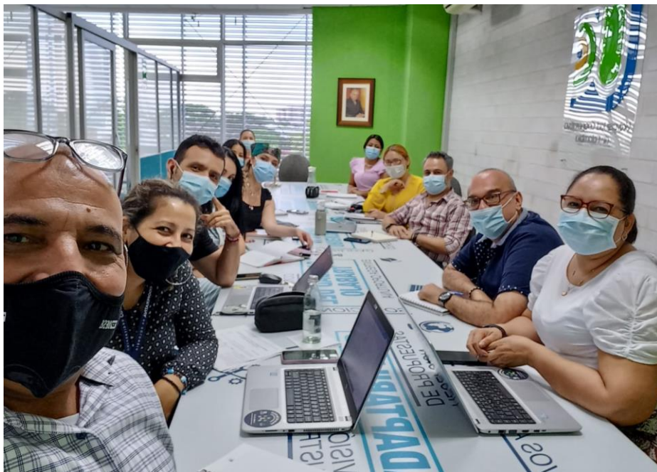
Equipo Comité Líder Rizoma Campus Barrancabermeja

Comprometidos con la universidad nos encontramos en sesiones periódicas para trabajar en pro del modelo.