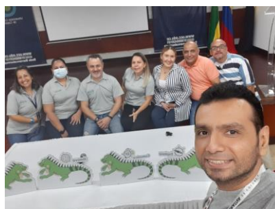
Sesiones, reuniones y conferencia