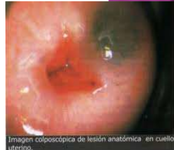
Imagen colposcópica de lesión anatómica en cuello uterino.