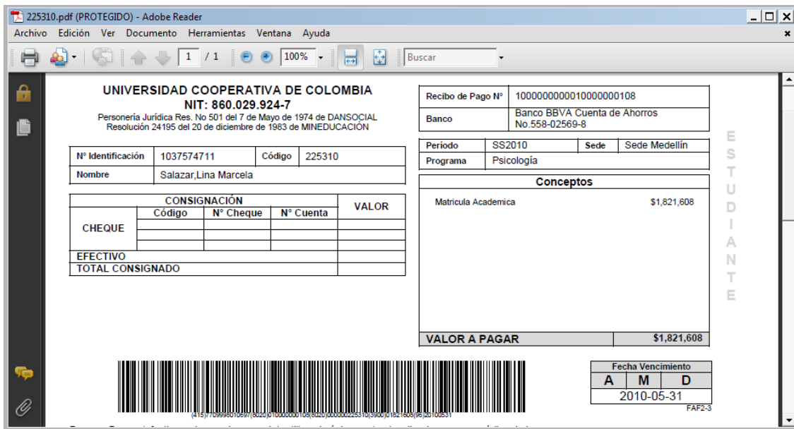
Figura 8 Recibo de Pago